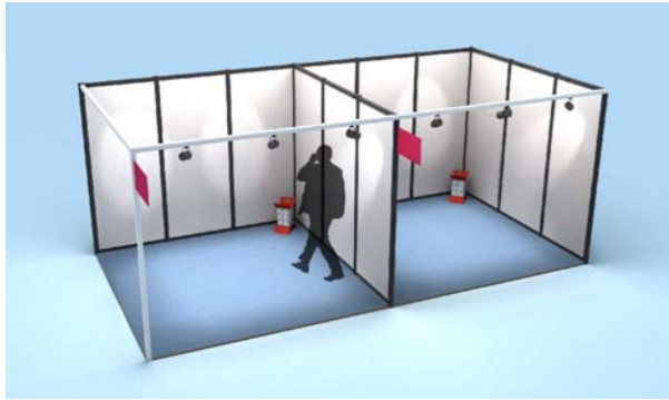
Schémas non contractuels

Possibilité de stand de 3 m 2 (priorité donnée pour une première participation) ou 6 m 2 sous conditions. Nous consulter pour les tarifs et disponibilités.